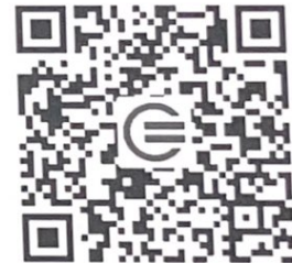
教育装备网公众号二维码

3.现场报名。4月19-20日，9:00-16:00，21日9:00-11:30在重庆国际博览中心报到处，实名登记填写相关信息后换取“参观证”进场观展。